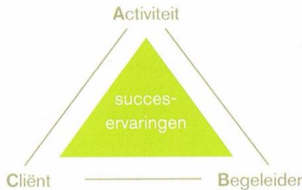
Figuur 3. Conflictmodel bij succeservaringen

Binnen het Mulderplein is de insteek om door het opdoen van succeservaringen tijdens het doen van activiteiten (die passen bij de fase waarin de bewoner verkeerd) de bewoner te laten groeien in zelfstandigheid en zelfvertrouwen. De begeleiding sluit nauw aan bij de directe leefwereld van de cliënt, is laagdrempelig en passend aanwezig, eventueel met ondersteuning van een dagprogramma.