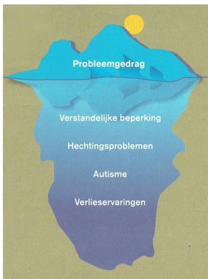
Figuur 1. Ijsbergmodel voor probleemgedrag

Locatie Mulderplein biedt ondersteuning aan mensen met een licht en matige verstandelijke beperking waarbij sprake kan zijn van bijkomende problematiek, namelijk autisme, psychiatrische problematiek, hechtingsproblematiek en agressie. Deze bijkomende problemen kunnen probleemgedrag veroorzaken. Binnen het Mulderplein gaan we daarbij uit van het ijsbergmodel, waarbij dit probleemgedrag wat aan de oppervlakte te zien is veroorzaakt wordt door dieperliggende problematiek.