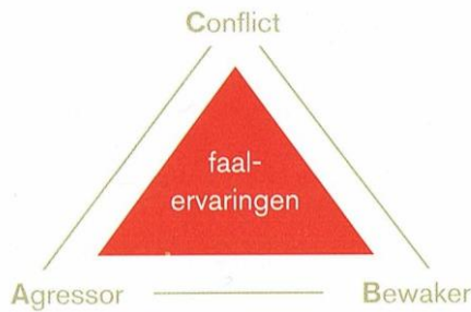
Figuur 2. Conflictmodel bij faalervaringen

Binnen het Mulderplein is de insteek om door het opdoen van succeservaringen tijdens het doen van activiteiten (die passen bij de fase waarin de bewoner verkeerd) de bewoner te laten groeien in zelfstandigheid en zelfvertrouwen. De begeleiding sluit nauw aan bij de directe leefwereld van de cliënt, is laagdrempelig en passend aanwezig, eventueel met ondersteuning van een dagprogramma.