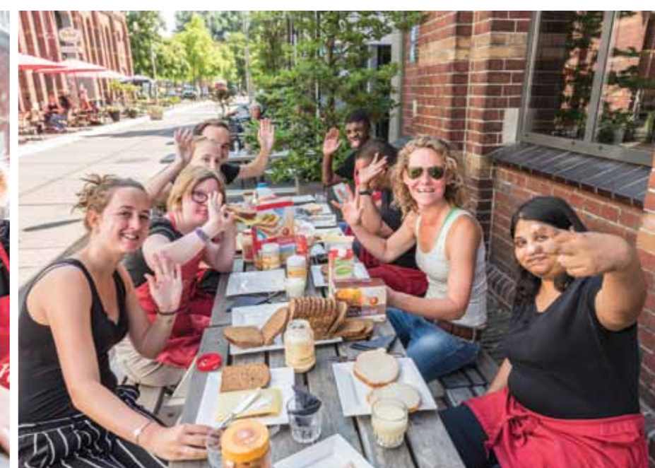
ZO. DE KLUS IS GEKLAARD!