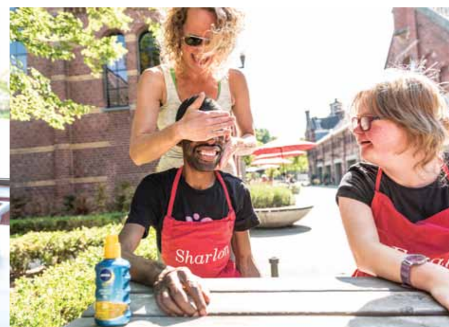
RARA, WIE BEN IK?