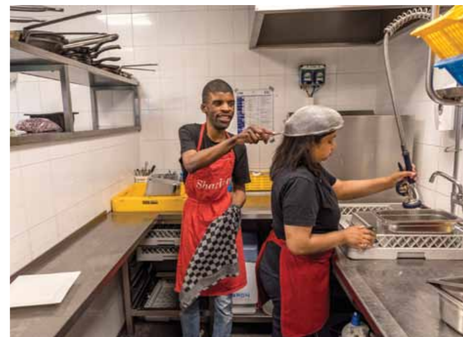
GEZELLIG SAMEN AFWASSEN