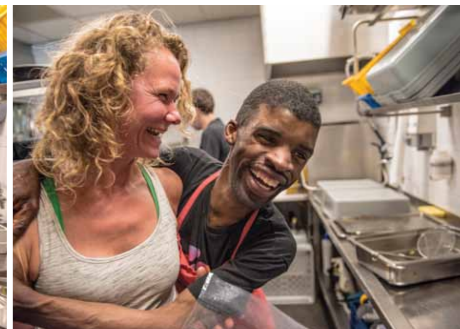
WE HEBBEN ALTIJD VEEL LOL