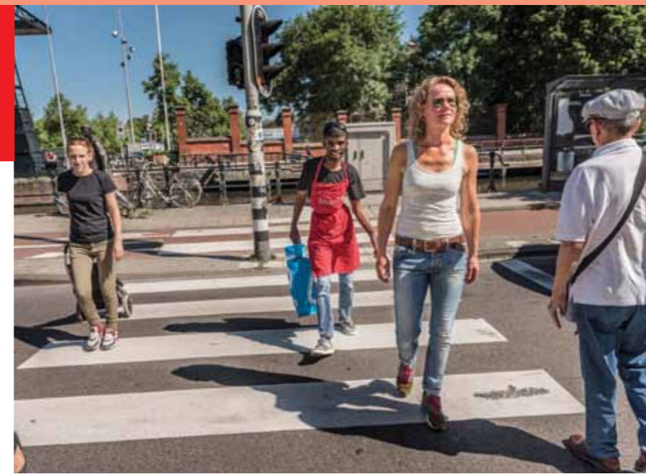
OP NAAR DE WINKEL

Na een dag hard werken, is het tijd voor een drankje. Lekker buiten op het terras! Als het mooi weer is. Want we houden wel van gezelligheid hier!