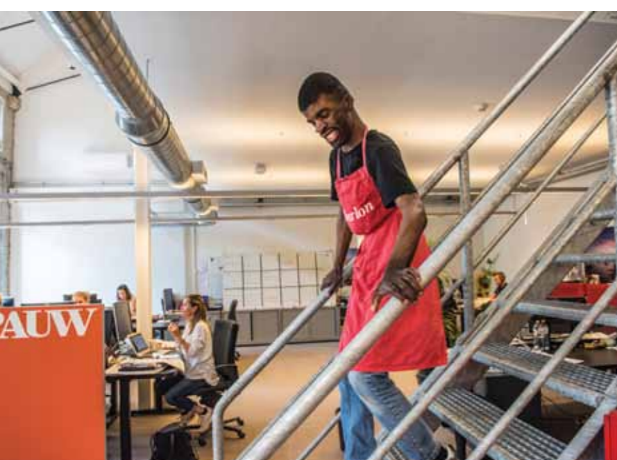
EVEN LANGS BIJ DE REDACTIE