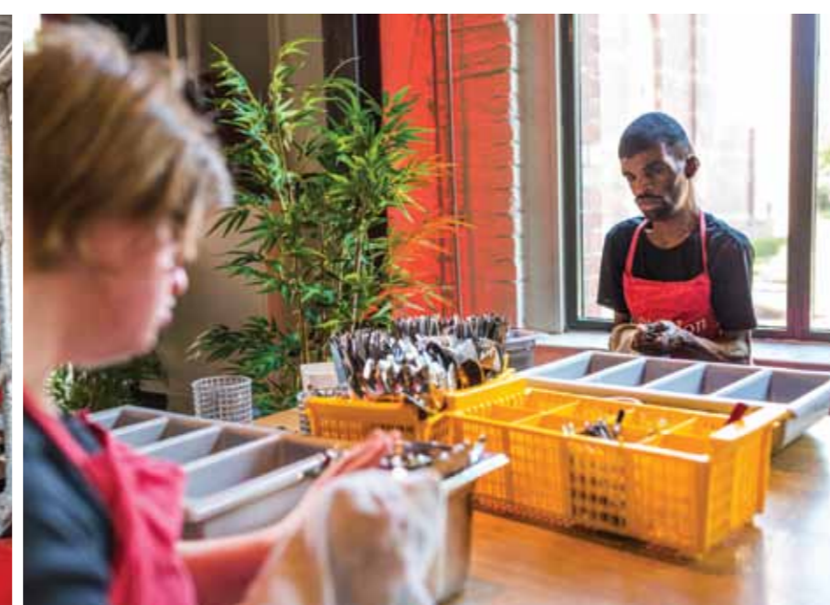
ALLES WORDT SPIC EN SPAN